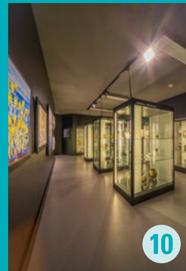
LEIDENSCHAFT FÜR PORZELLAN – HELMUT DREXLER