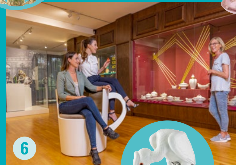
DIE GOLDENEN ZWANZIGER