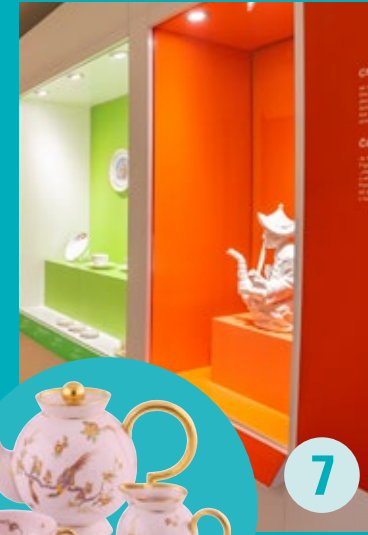
KABINETT DER BESONDERHEITEN