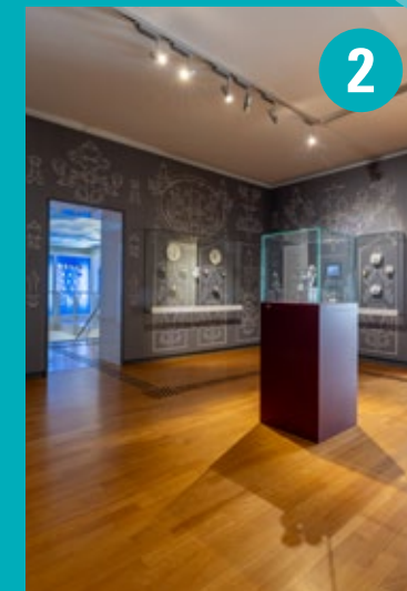
DAS 18. JAHRHUNDERT